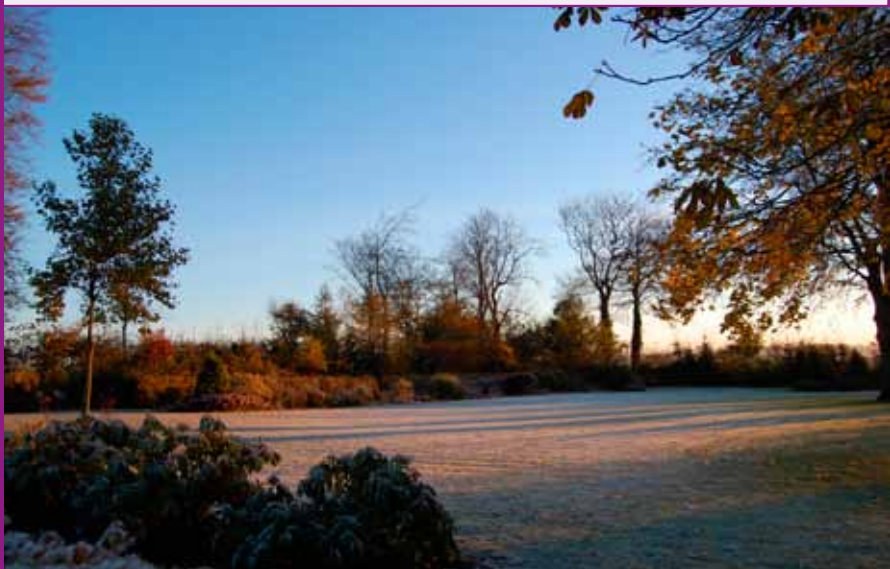
Foto af præstegårdshaven en frostklar morgen i oktober 2010

Forsidefoto: Et udsnit af Isenheimalteret