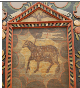
Påskelammet på Ravnkilde kirkes altertavle

Det første store kirkemøde, hvor kristne biskopper fra hele verden var samlet for at træffe beslutninger vedrørende den kristne kirke, fandt sted i Nicæa i år 325. De diskuterede bl. a. fastlæggelsen af Jesus' dødsdag. På det tidspunkt anvendtes den julianske kalender af de kristne. Det er en solkalender,