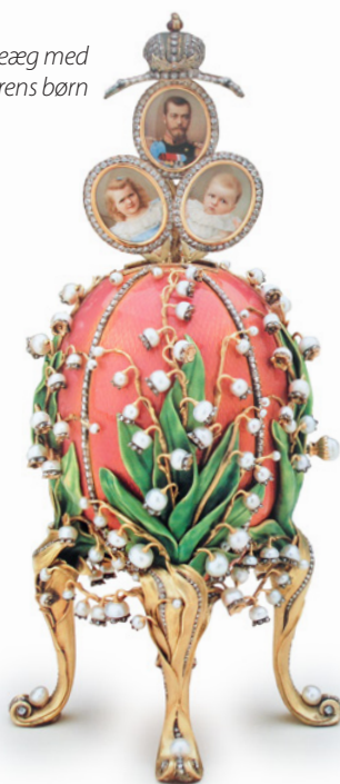
Påskeæg med zarens børn

Først over 500 år efter Jesus' død, fandt en munk frem til en udregning, der kunne opfylde de vestlige biskoppers ønske. Med den gregorianske kalenders indførelse i 1582 kunne vi så "nemt" fastlægge den kristne påske.