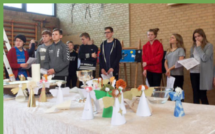
Fællessangen under gudstjenesten, hvor der blev sunget for forældre og andre pårørende