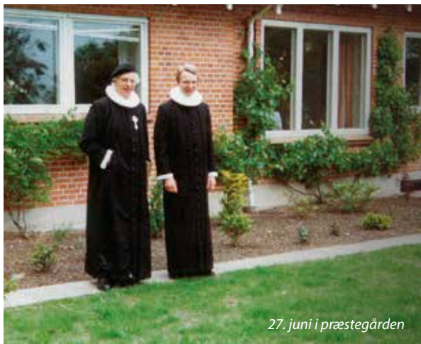
27. juni i præstegården

alvor, da I viste mig den tillid at kunne bruge mig, også i de sværeste stunder i jeres liv. Formelt blev jeg præst 21. juni 1982 i Viborg domkirke, men reelt var det jer, der gjorde mig til præst ved at bruge mig som præst. Og I lærte mig, hvad det ville sige at være præst hos jer. Som mine forældre sagde en gang i de første år: Det glæder os, at du er kommet så godt et sted hen, hvor man er så god ved dig!