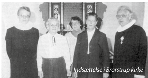
Indsættelse i Brorstrup kirke