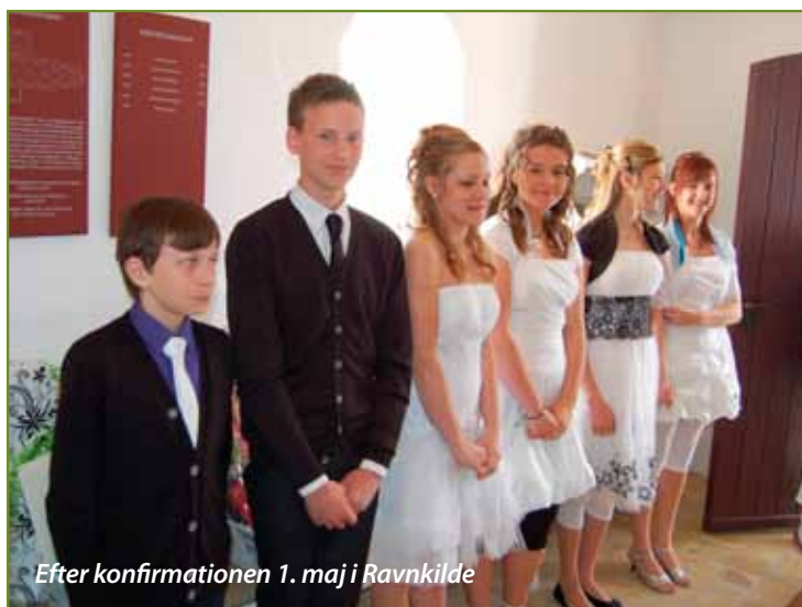
Efter konfirmationen 1. maj i Ravnkilde