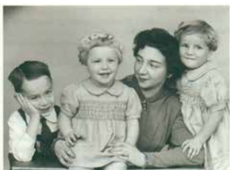
Min mor med sine tre børn i midten af 1950'erne. Det er mig ydrest til højre.