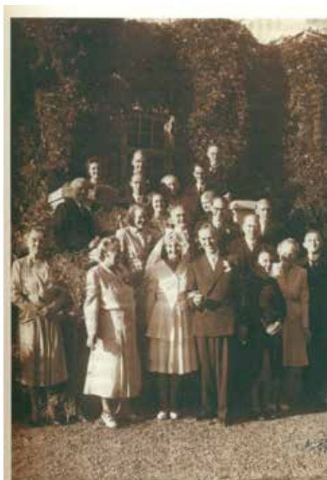
Minne forældres bryllup fredag den 29. august 1947. Her står de med gæsterne på trappen til min fars barndomshjem, Østerhus, i Fredericia. Ved siden af min far står min mormor og bag hende min farfar. Lige bag min mor står min morfar, mors min farmor står ved siden af min mor.