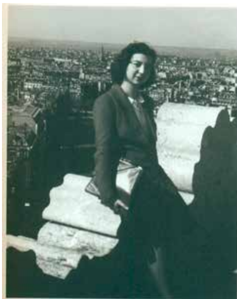
Min mor i Paris i påsken 1947, den dag hun viste min far rundt i byen, og de forlovede sig.