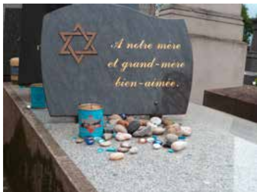
Jødisk gravsted i Paris