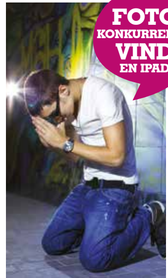
FOTO KONKURRENCE VIND EN IPAD

Jeg tror, at det kan blive en stor oplevelse at deltage i de to gudstjenester.